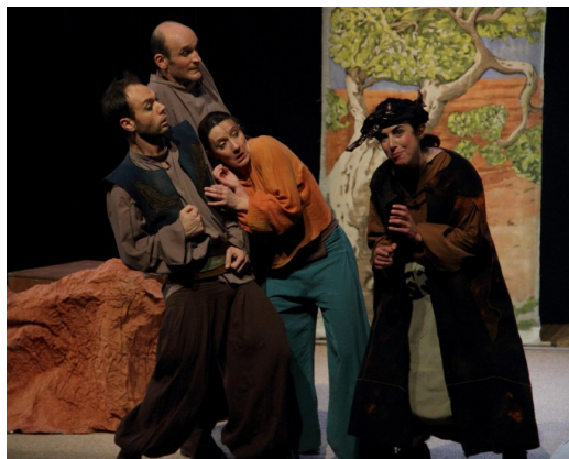
Les Enragés de Sassoun, 2016

La compagnie a développé son univers artistique au fil de ses créations. La mise en scène est stylisée et s'attache au visuel avec des personnages très dessinés. Le corps parle avant les mots et la suggestion emporte l'imagination du spectateur.