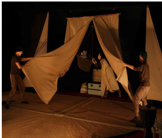
La Tempête, adaptation de la pièce de W.Shakespeare